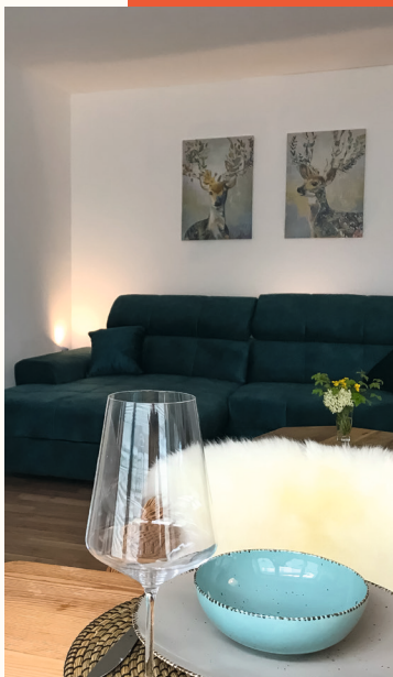
EG 80 qm, barrierefreie Wohnung mit Stellplatz Für 2 - 4 Personen