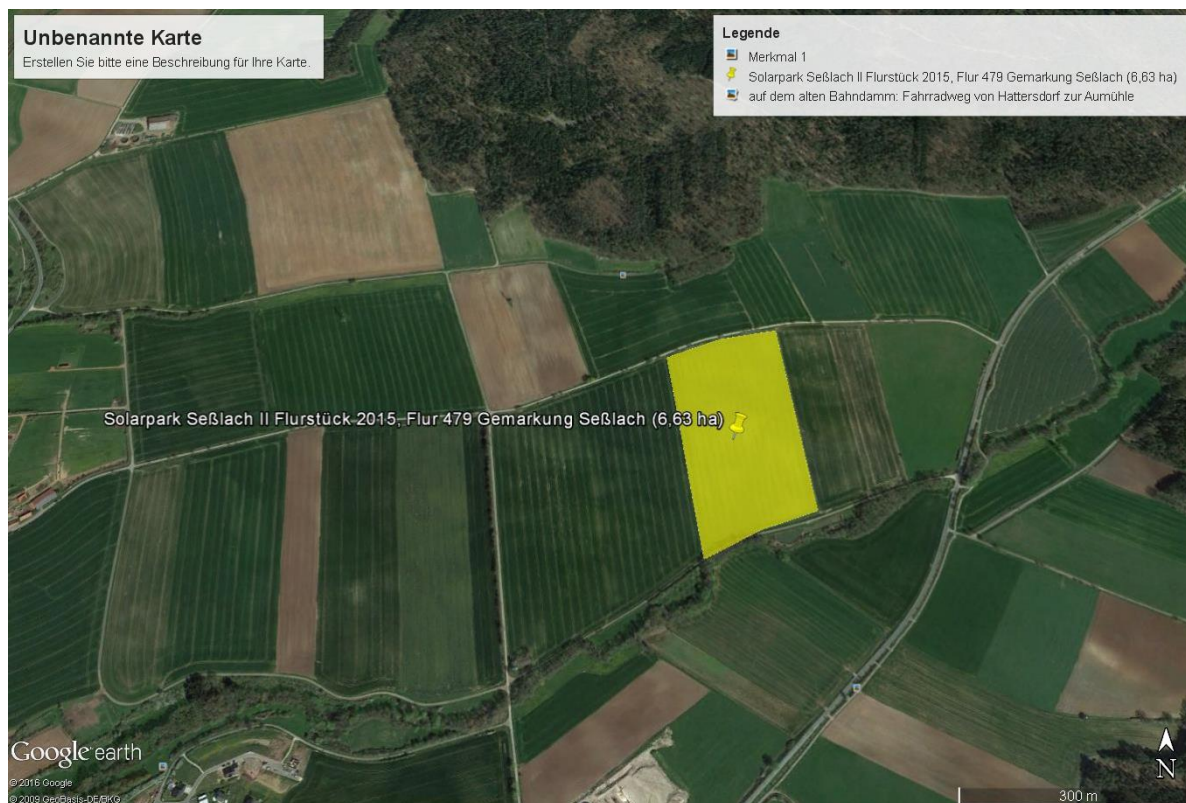
Solarpark Seßlach II, Auszug aus google earth